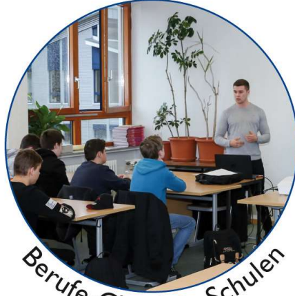
Berufe-Check in Schulen