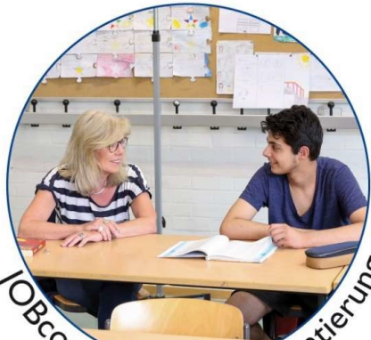
JOBcoaches geben Orientierung

Angebote für Schüler der Klassen 8 bis 10