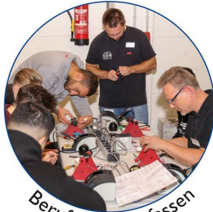
Berufe zum Anfassen