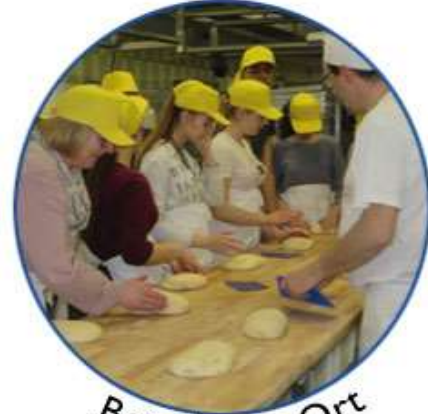
Berufe vor Ort