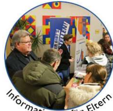
Informationen für Eltern